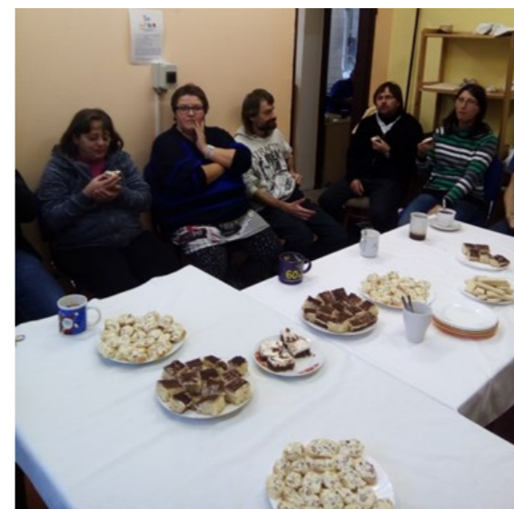
Spolupracovníci z prádelny pozorně naslouchají